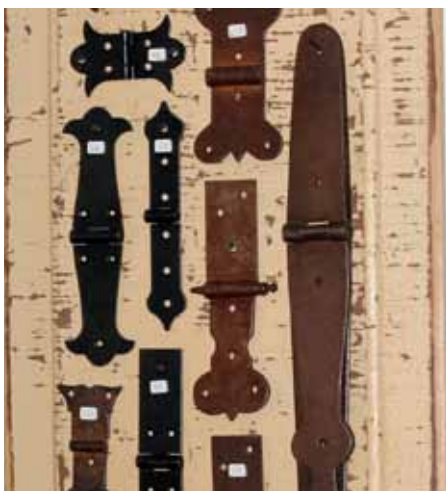
Återanvändning, bra för miljön och affärerna