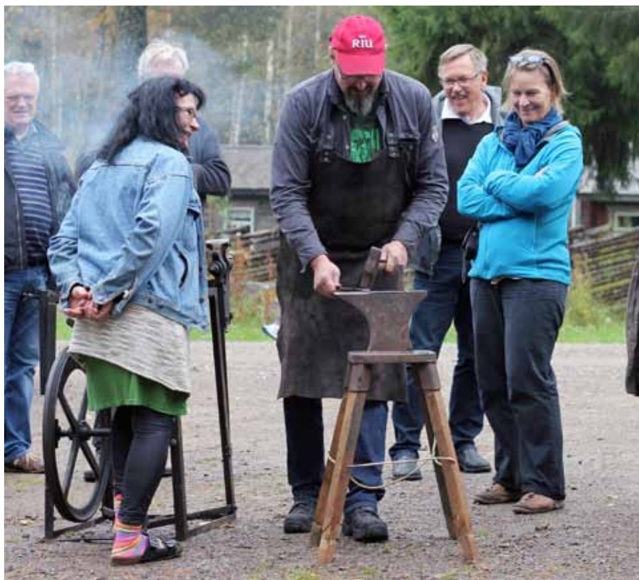
Man smider medans järnet är varmt

sin ässja. Själv smider han förutom bruksföremål även konstsmide. Dessutom brukar han åka ut och låta sällskap pröva på konsten att forma järn med hjälp av eld, hammare och städ.