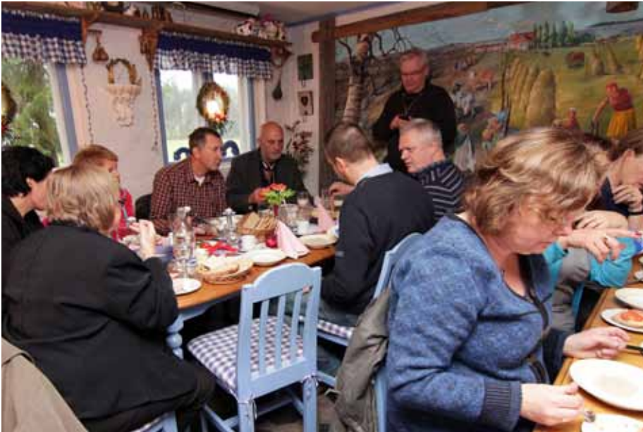
Vackert och gott i nya ladugården