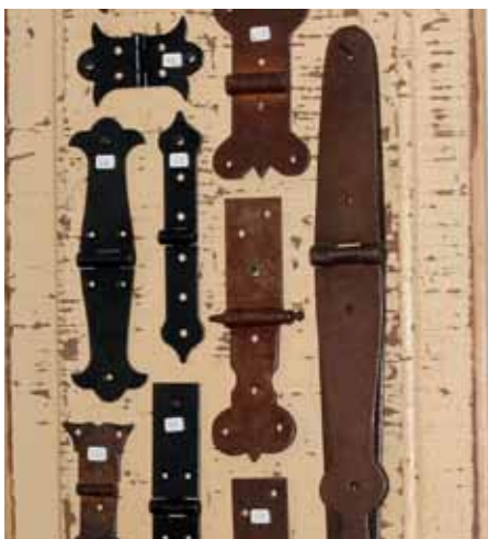
Återanvändning, bra för miljön och affärerna